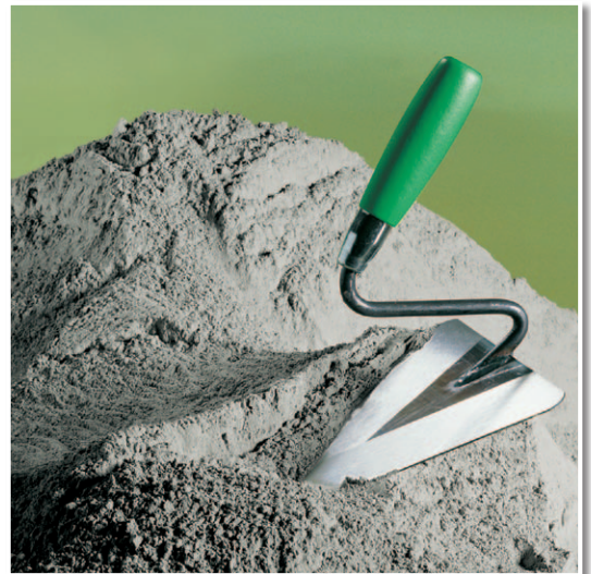
Grauer Portlandzement für das individuelle Bauen.

Zum Selbstanmischen von verschiedenen Mörtelarten, z. B. Verlegemörtel, Putzmörtel, Reparaturmörtel.