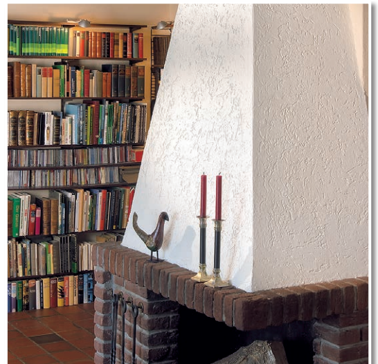
Kaminschürze rustikal gestalten. Repräsentativ, dekorativ, strapazierfähig.